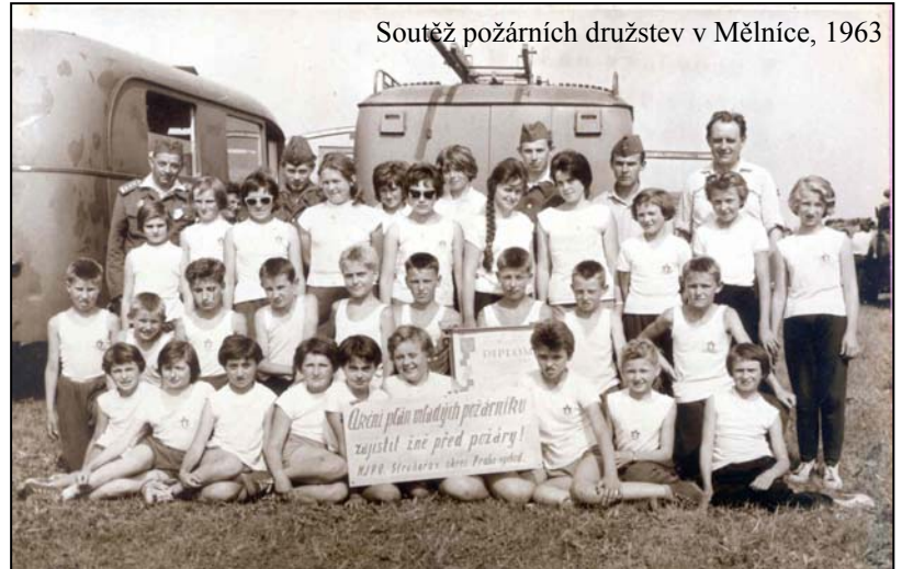
Soutěž požárních družstev v Mělnice, 1963

Přes zlepšení materiální výbavy jednoty, se postupem času začaly stále vážněji projevovat nedostatky v ještě účinnější technice, výzbroji a výstroji, která byla za pomoci nadřízených složek postupně v rámci možností doplňována. Největším nedostatkem na úseku požárního zabezpečení obce zůstávala naprosto nedostatečná možnost uskladnění veškeré požární techniky, kterou měl sbor k dispozici. Na základě neustálého zdůrazňování tohoto nedostatku členy základní organizace došlo po 15 letech konečně dne 2. září 1983 k dohodě mezi MNV a ZO SPO a po schválení ONV Praha – východ k výběru staveniště, povolení a financování stavby nového požárního domu. Stavba byla prováděna formou tzv. „Akce Z“ (pro mladší čtenáře – jednalo se o zvelebování měst a obcí občanskou svépomocí, organizovanou národními výbory, převážná část prací byla