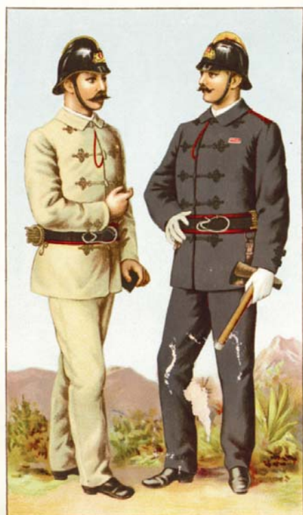
Vil. Flck a synové, Praha-Smíchov.

Zakládajícími členy bylo dle ověřených záznamů bylo 12 občanů. Nově ustavený požární sbor byl nejdříve součástí Župy Podlipanské Českobrodské, a později Župy Posázavské. Vzhledem k tomu, že nejsou k dispozici kompletní autentické záznamy, je možno vývoj sboru posuzovat v počátcích jeho práce pouze všeobecně a neúplně. Zdá se však, že práce sboru od r. 1895 byla cílevědomá, že sbor pracoval dobře, ale s velkými zejména finančními obtížemi při obstarávání potřebné výstroje a výzbroje. Po delším časovém období od založení sboru dochází 11.července 1908 k výměně většiny členů výboru (jejich odstoupení a pravděpodobně únava z práce nebo nemoci) a naproti tomu k získání nových mladších členů. V roce 1908 vstoupilo do sboru 10 a následovně v roce 1909