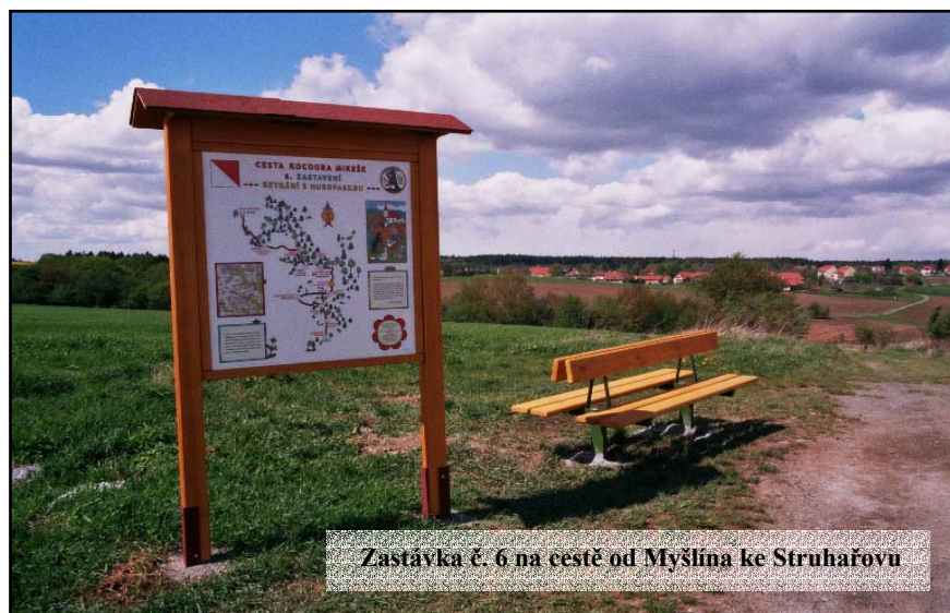
Zastávka č. 6 na cestě od Myšlína ke Struhařovu

Slosování proběhne na poutích, které se v Ladově kraji pořádají. Abyste zjistili, kdy a kde se jednotlivé poutě konají, sledujte webové stránky Ladova kraje.