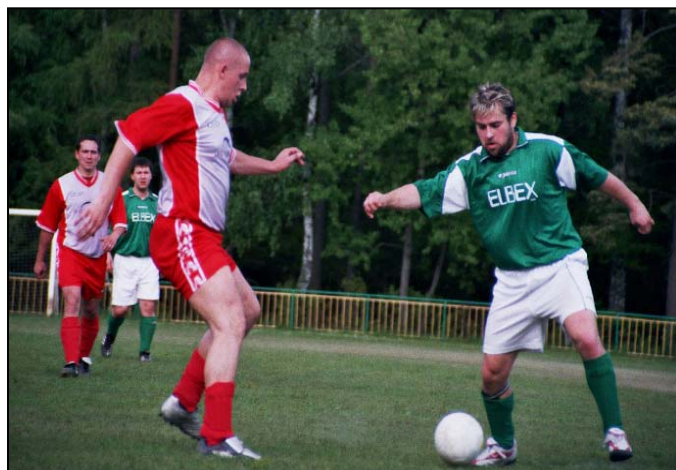
Ze zápasu Struhařov A - Březi 2:2