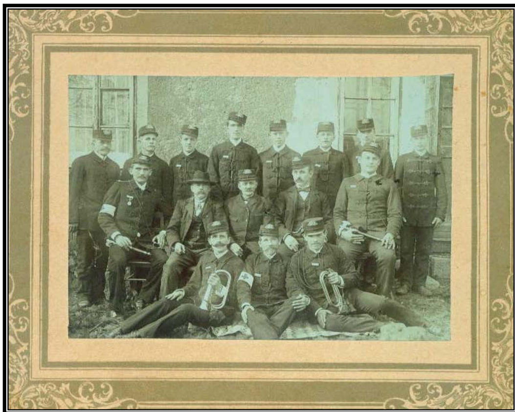
U této fotografie struhařovských hasičů pocházející ze začátku století se (stejně jako u fotografie na titulní straně) bohužel nedochovala jména ...

Také v našem nejbližším okolí došlo k ustavení dobrovolných hasičských sborů již v prvopočátku, a to v Řičanech a v Mnichovicích. Po jejich vzoru byl ustaven 1.března 1895 dobrovolný hasičský sbor ve Struhařově.